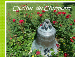
Cloche de Chirmont

En passant par la Faloise, retour vers le plan d'eau de Berny sur Noye.