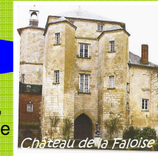
Château de la Faloise

Depuis le plan d'eau, cap au sud, le long de la vallée de la Noye