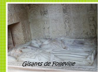
Gisants de Folleville